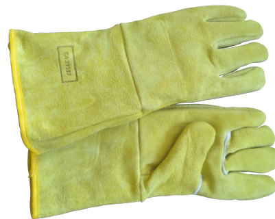
280051 LUIVA DE RASPA MAXXSOLDA TOP 15CM