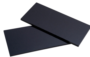
282004 LENTE TON 10 RETANGULAR 51X108mm