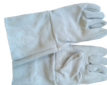
280049 LUIVA DE RASPA 15CM