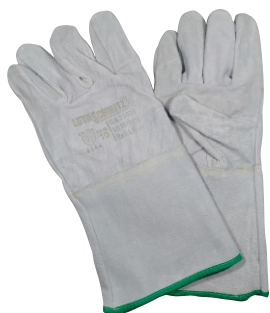
280004 LUIVA DE RASPA 15cm T10