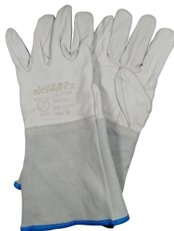
280007 LUIVA DE VAQUETA 15cm T9