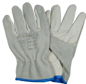
280010 LUIVA MISTA 7cm T9