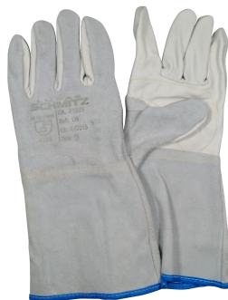
280011 LUIVA MISTA 15cm T9