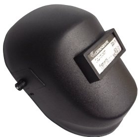
282001 MÁSCARA DE SOLDA FIXO S/ CATRACA