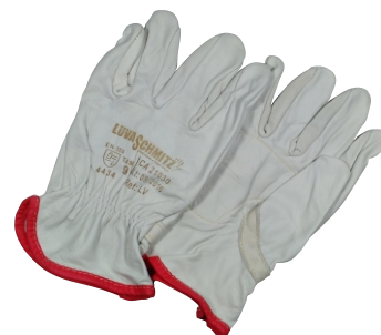
280008 LUIVA DE VAQUETA PETROLEIRA T9