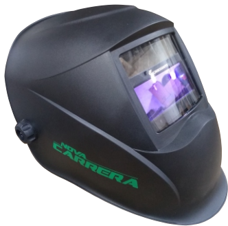
282018 MASCARA DE SOLDA NOVA CARRERA