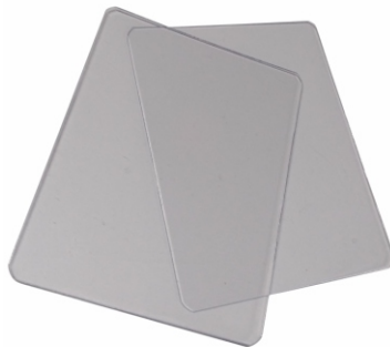
282011 PLACA DE PROTEÇÃO EXTERNA 90X110 CV3